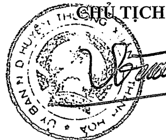
Cầm Bá Xuân